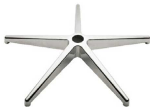
Base giratoria de aluminio pulido.