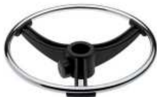
Aro reposapiés cromado con ajuste de altura ROUND.