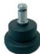
Juego de topes (5) antideslizantes de nylon negro.