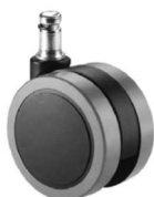
Juego de ruedas (5) de rodadura blanda de Ø65 mm.