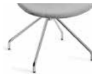
Base giratoria piramidal de cuatro radios sin ruedas en tubo de acero cromado