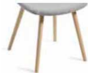
Estructura de cuatro patas de madera