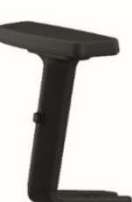
Brazos 2D. 2D Regulable en altura y profundidad. Color negro.