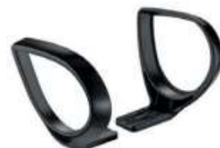
Brazos JACK. Fijos. Color negro.