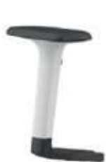
Brazos 1D. 1D Regulables en altura. Color blanco-negro.