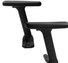
Brazos 3D/4D. 3D Regulables en altura, profundidad y giro. 4D Regulable en altura, profundidad, giro y ancho entre brazos.