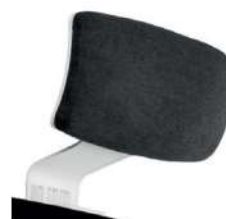
Apoya cabezas regulable tapizado.