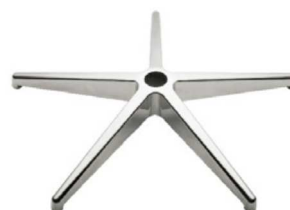
Base giratoria de aluminio pulido.