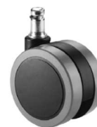
Juego de ruedas (5) de rodadura blanda de Ø65 mm.