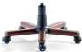
Base giratoria de madera de haya acabados natural, nogal o caoba